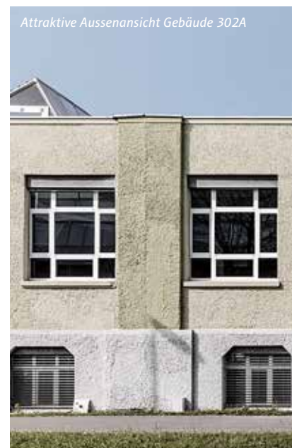
Attraktive Aussenansicht Gebäude 302A