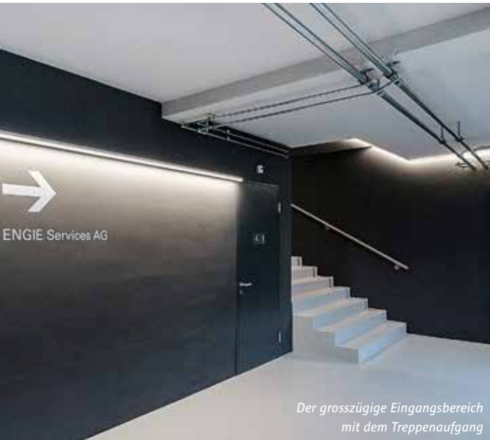
Der grosszügige Eingangsbereich mit dem Treppenaufgang